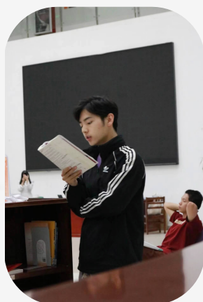
不啻微茫,造炬成阳