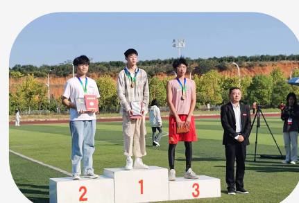
奋于笃行,臻于至善