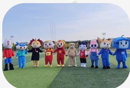
旦逢良辰,顺颂时宜