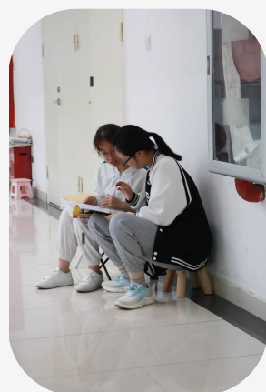
岁月缝缝,葳蕤生香